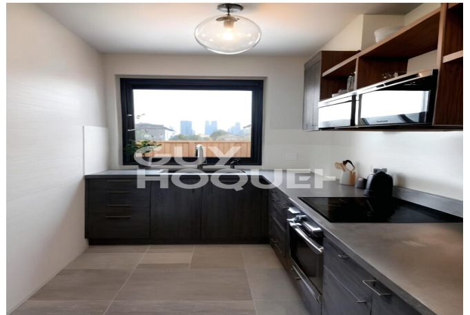
Immobilier rapell avec oruill rrvol een ootrrieh inife proposée par Flaash ai