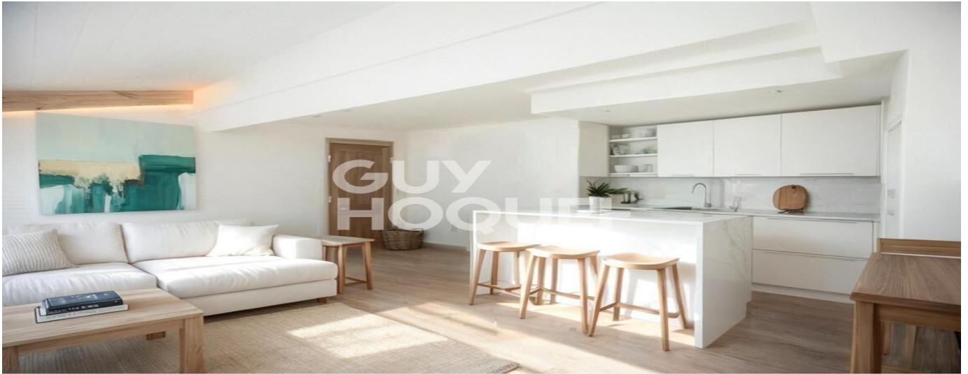
Proposition d'aménagement virtuel non contractuelle