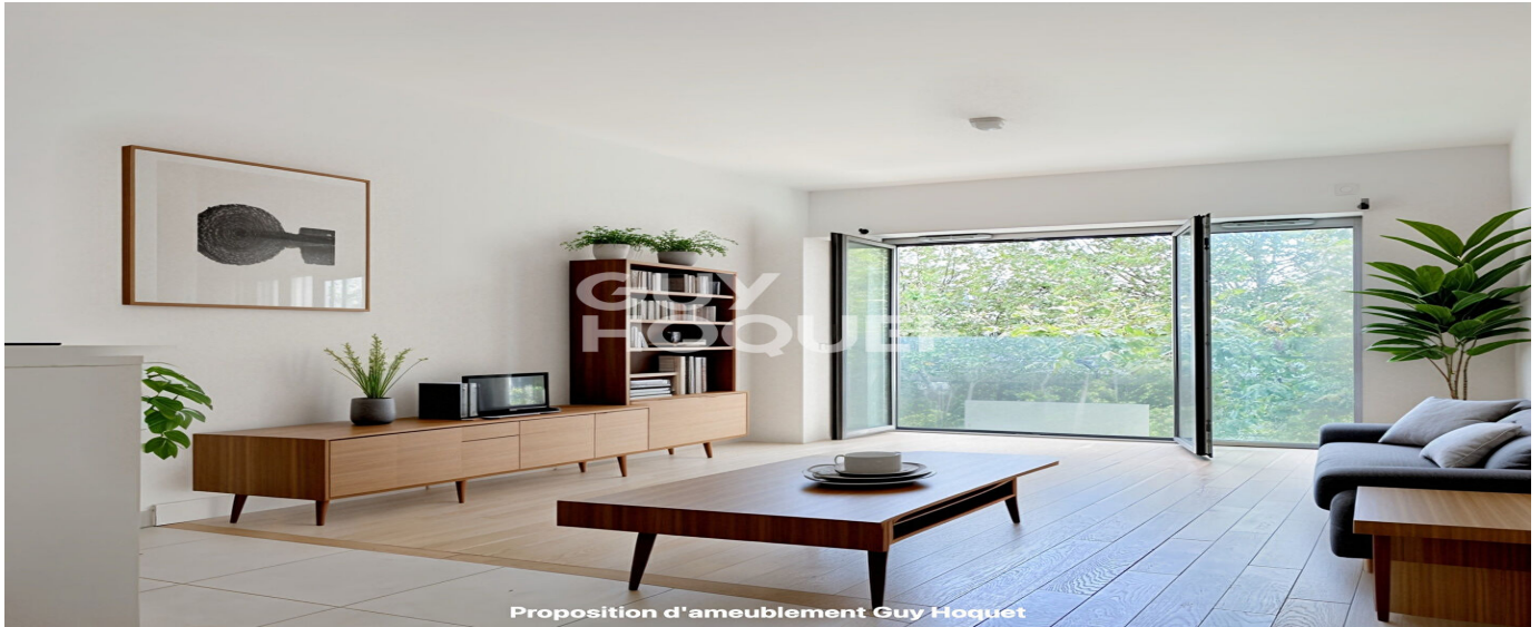
Proposition d'ameublement Guy Hoquet