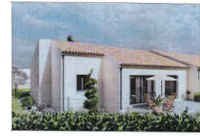
Villa T4 de 103,06 m 2 avec garage de 16,71 m 2 sur un terrain de 446m 2