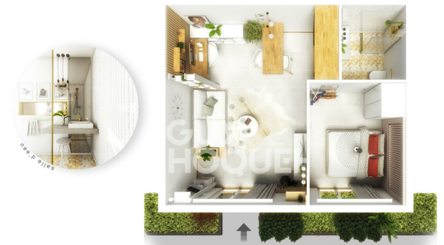
Proposition salle d'eau - clair - carrelage géométrique (sol) - carrelage mosaïque (mur)