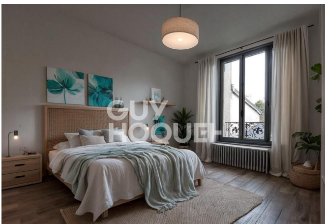
Proposition d'aménagement virtuel non contractuelle proposée par Flaash.ai