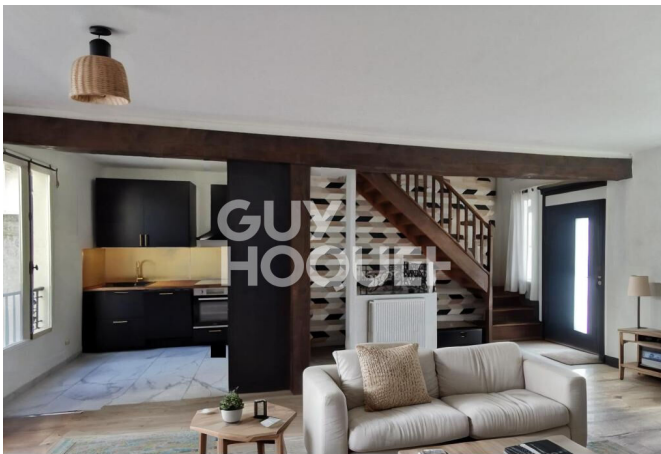
Proposition d'aménagement virtuel non contractuelle proposée par Flaash.ai