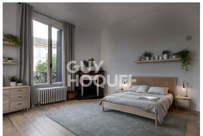
Proposition d'aménagement virtuel non contractuelle proposée par Flaash.ai