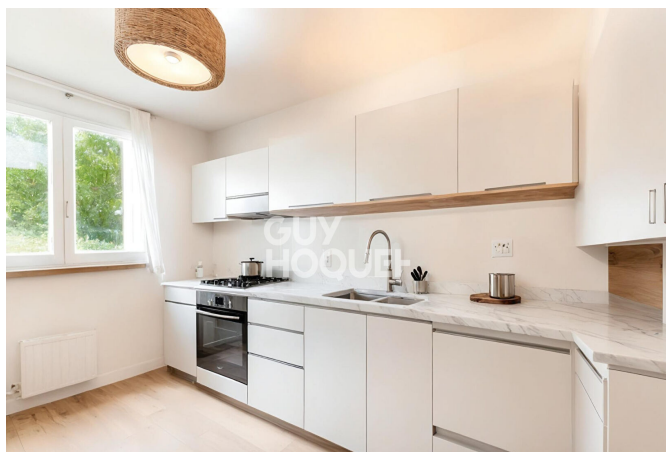
Proposition d'aménagement virtuel non contractuelle proposée par Thomas PIC