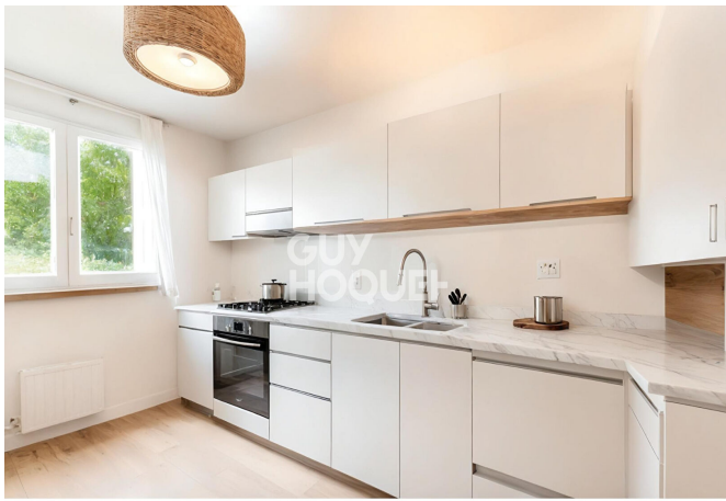
Proposition d'aménagement virtuel non contractuelle proposée par Thomas PIC