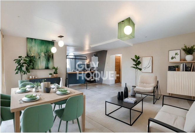
Proposition d'aménagement virtuel non contractuelle proposée par Thomas PIC