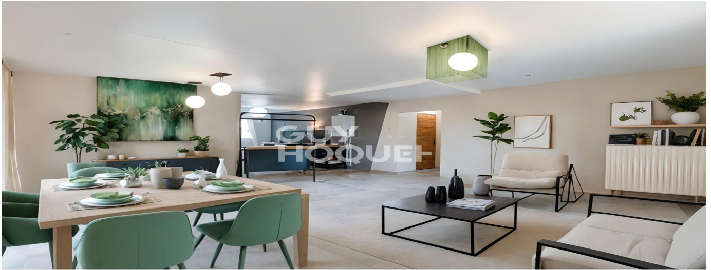
Proposition d'aménagement virtuel non contractuelle proposée par Thomas PIC