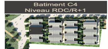
Batiment C4 Niveau RDC/R+1