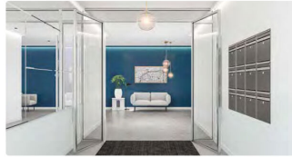
Exemple de hall sécurisé