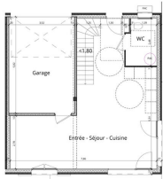
Rez de jardin