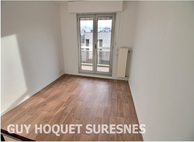
GUY HOQUET SURESNES