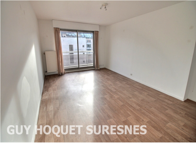
GUY HOQUET SURESNES