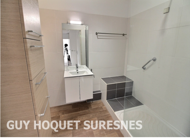
GUY HOQUET SURESNES