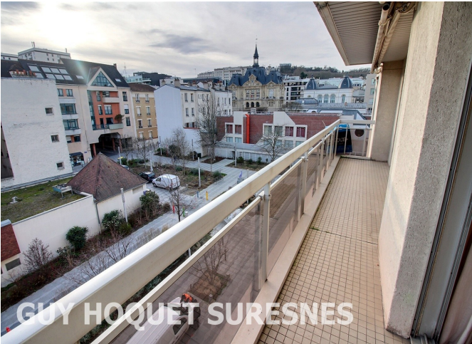
GUY HOQUET SURESNES