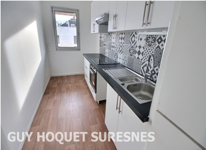
GUY HOQUET SURESNES