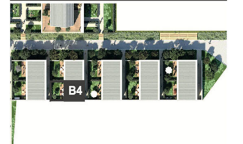
Duplex 4 pièces- n° B4-002