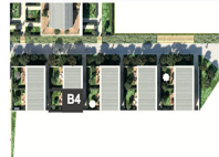
Duplex 4 pièces- n° B4-002