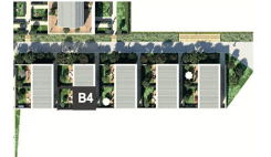
Duplex 4 pièces- n° B4-002