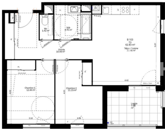
"PLAN DE VENTE"