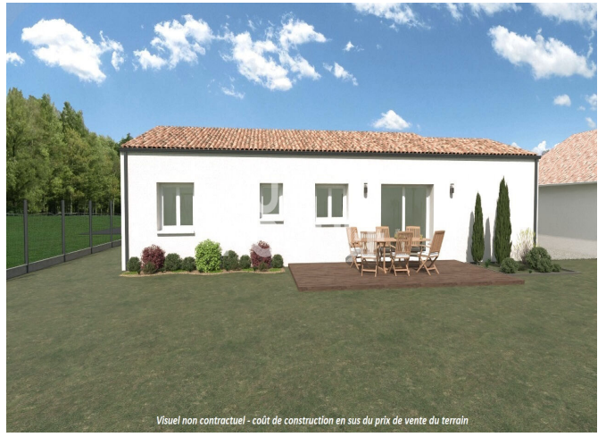
Visuel non contractuel - coût de construction en sus du prix de vente du terrain