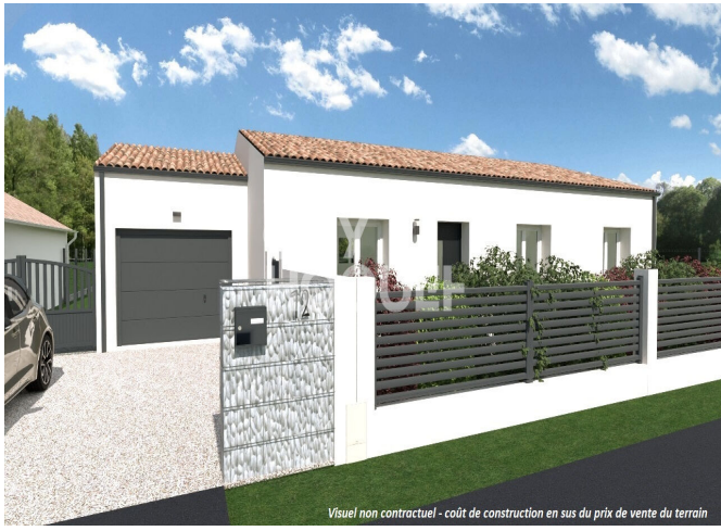
Visuel non contractuel - coût de construction en sus du prix de vente du terrain